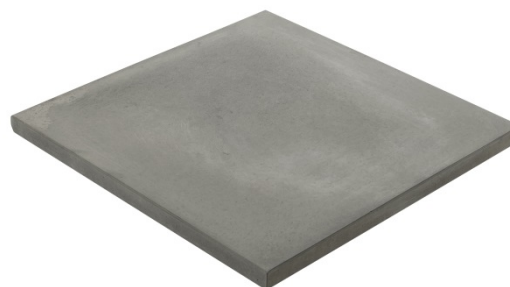
Dimensões e Fotografia da Peça