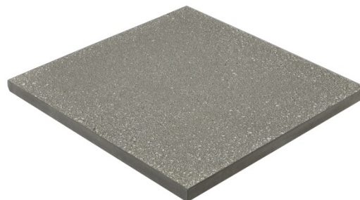
Dimensões e Fotografia da Peça