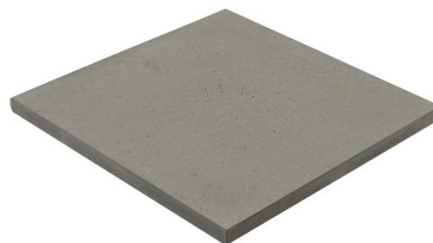
Dimensões e Fotografia da Peça